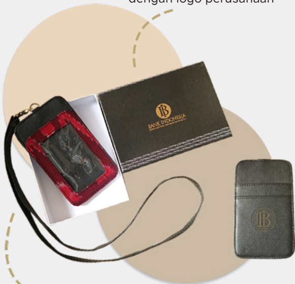
Tampak depan di desain dengan tenun dilengkapi handle yang bisa lepas pasang