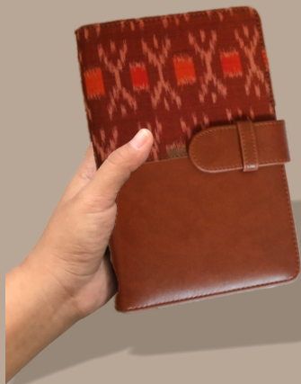
Agenda Ukuran B6 Ukuran agenda 14 x 21 cm