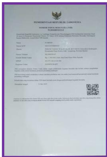
Nomor Induk Berusaha (NIB)