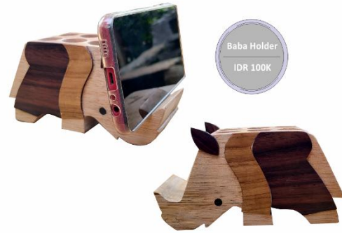
Baba Holder IDR 100K