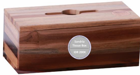
Sandria Tissue Box IDR 200K