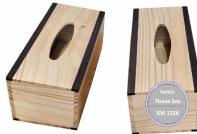
Venta Tissue Box IDR 135K