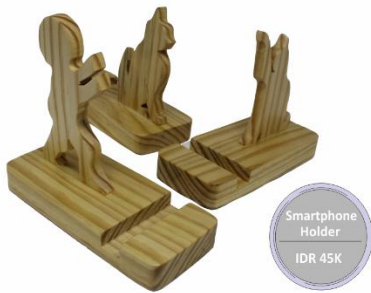
Smartphone Holder IDR 45K