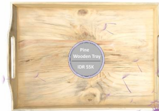
Pine Wooden Tray IDR 55K