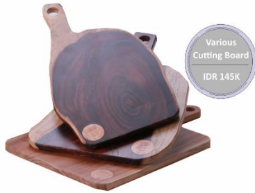
Various Cutting Board IDR 145K

"Melakukan sesuatu dengan jiwa, kreatifitas dan cinta"