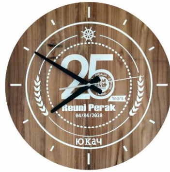
Woodclock Teakwood IDR 600K