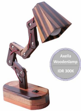
Axella Woodenlamp IDR 300K