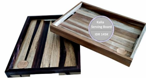
Kalia Serving Board IDR 145K