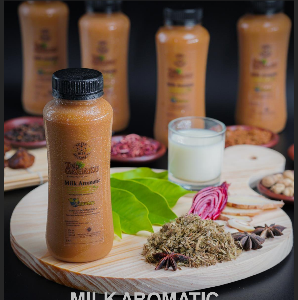
MILK AROMATIC AGARWOOD TEA