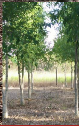
3 years old