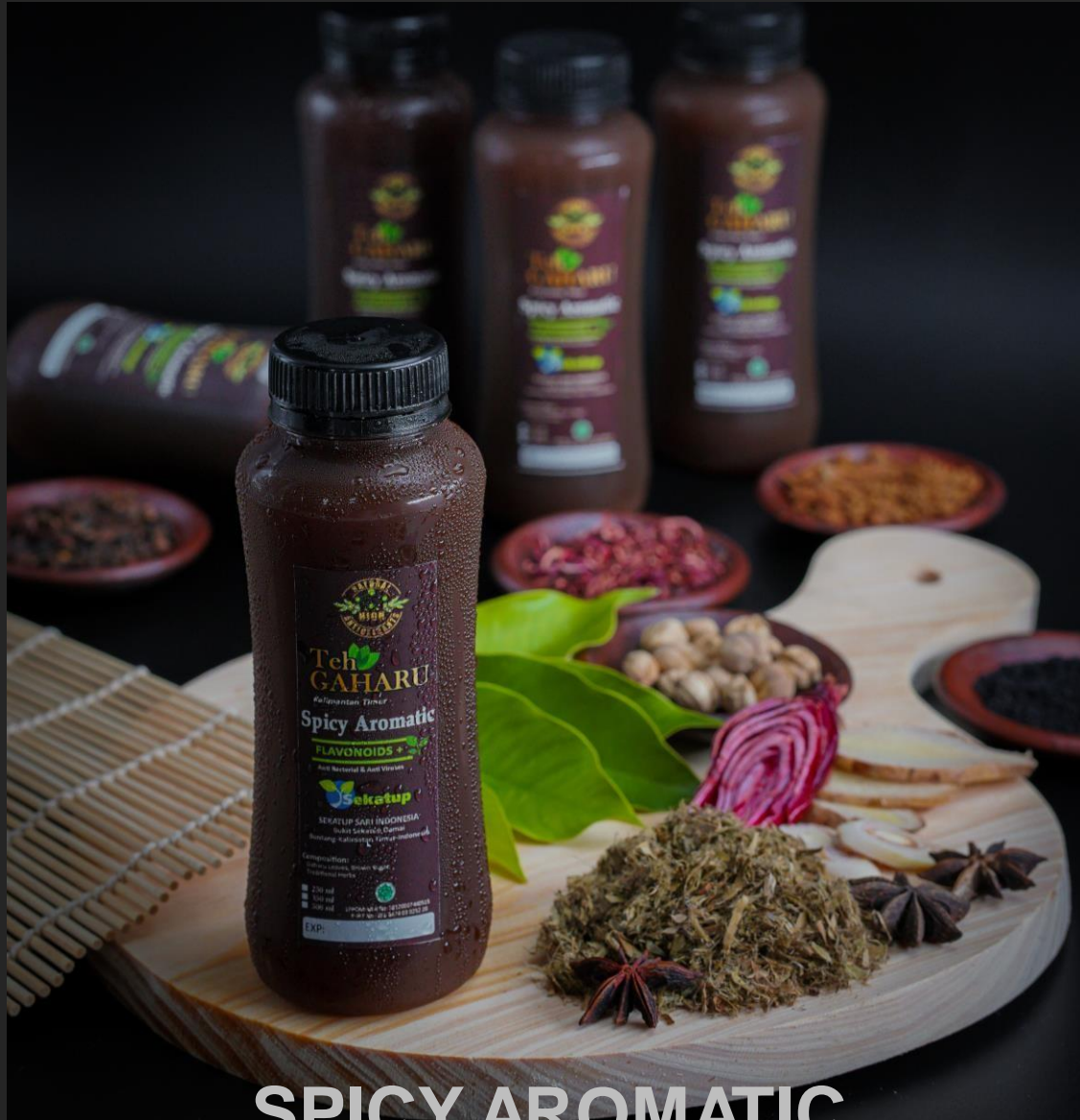
SPICY AROMATIC AGARWOOD TEA