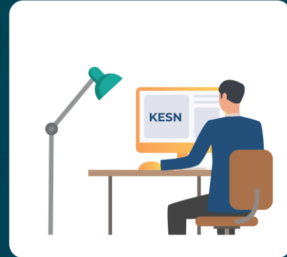
Posisi Kamera #2